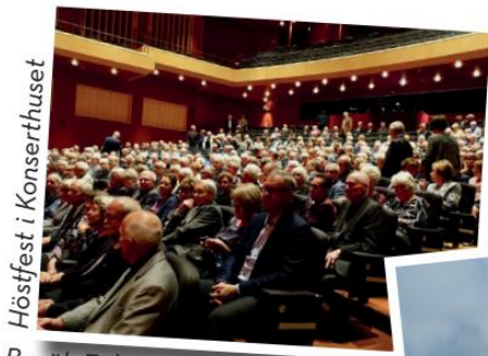
Höstfest i Konserthuset