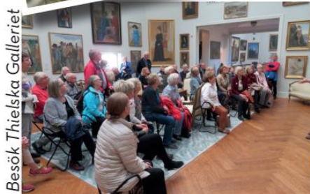
Besök Thielska Galleriet

Resor Utflykter Studiebesök Teater Kurser Friluftsliv